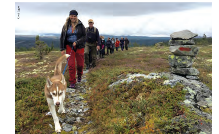
Glade vandrere på veg til Storhøa, tur 17.