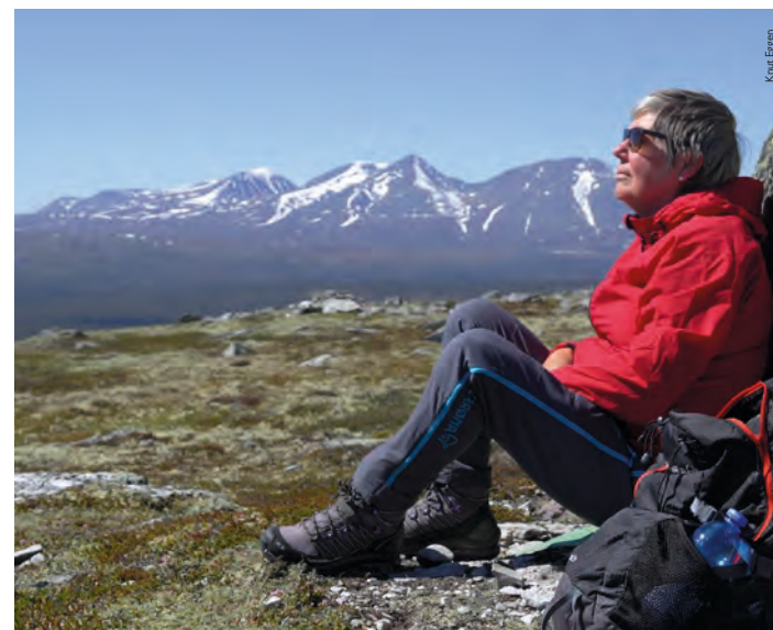
Ikke mange turmål slår Galtåskampen tur nr 8 på utsikten.

Dette er grendefjellet til grendene ved Sølénstua, inkludert også campingplassen og hytteområdet.