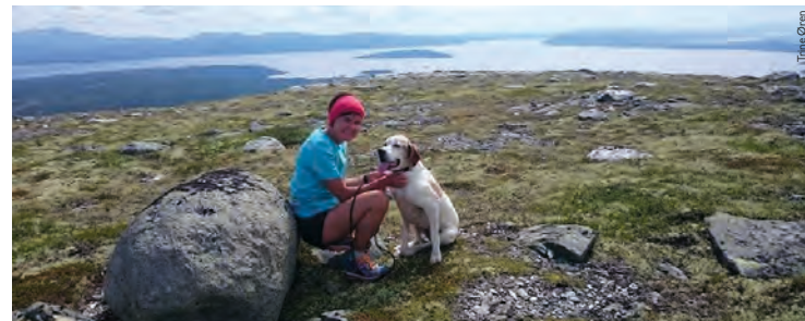
På Kvennvikhøgda møtes tre kommuner i denne fantastiske utsikten over Femunden.

Glofökkampen er 1326 moh og den sjuende høyeste fjelltoppen i Engerdal. Grensepunkt mot Rendalen. Stien er gradert rød fordi den stiger litt over 600 meter hvis du starter fra Johnsgård ved Langsjøen i Sømådal. Du kan kjøre