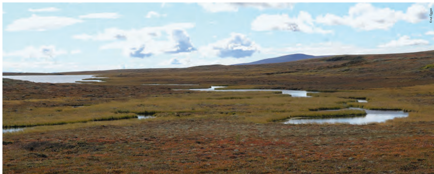
Fra Svarthammaren, tur nr 13, kan du nyte utsikten over den idylliske Blakksjøen.