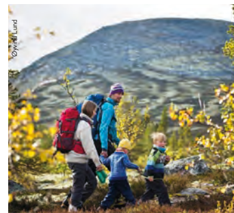
Fra Johnsgård oppover mot Glofökkampen tur nr 6 er det fint å gå for hele familien. Kanskje ikke helt til topps for alle.

I utstrekning, ja. Noen mener at det er en største, fordi adkomsten er universelt utformet med båt. Tilgjengelig for alle.