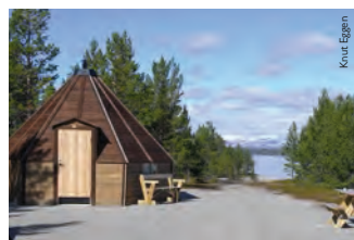
Ved Elveoset ender Elgåstien i en flott plass med lavvo, do, benker og bord.