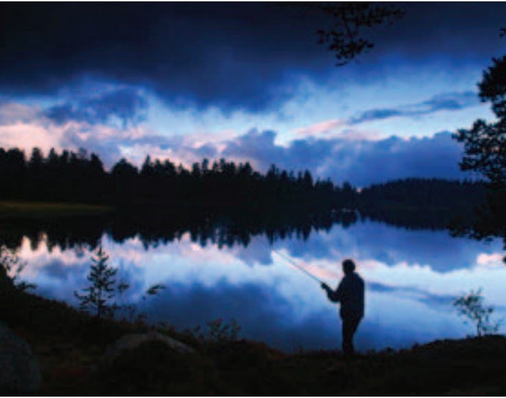
Jyltingsmarka en juninatt.

Jyltingsmarka er et idyllisk skogsområde nord-øst for Drevsjø der 7–8 sjøer ligger tett sammen med korte elvestrekninger imellom. Området er fint både til padling og fisking. Stor harr og stor abbor er vanlig. Gjedde og sik finnes også. Tilgjengeligheten er god til deler av området som følge av et velutviklet skogsbilvegnett.