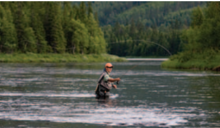
I de nedre delene av Femundselva er vadere nyttig under utøvelse av fluefiske.

Fjellstyrets fiskekort omfatter her østsida av Femundselva fra Galtsjøen til Aursjøbekkens utløp (opp for Elvbrua). Derfra og ned til Trysilgrensa gjelder fiskekortet på begge sider av elva. Hele elvestrekningen er ca 45 km og veksler mellom kvasse stryk og stille floor. Fangstbegrensninger på stor ørret og harr i Gløta, Isterfossen, Galtstrømmen og Femundselva. Se fiskereglene på fiskekortet. En del mindre tjern med fin ørret og røye finnes mellom Galten og Trysil grense. Lett adkomst også til disse.