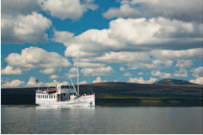
Rutebåten Femund II frakter årlig svært mange fiskere og turvandrere til Femundsmarka. I finværsdager er selve båtturen fra Synnervika til Elgå en stor naturopplevelse.